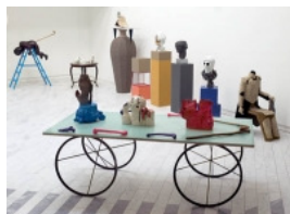
Installationsview af Orgie på Traneudstillingen.

"Rent praktisk fungerer vores samarbejde sådan, at vi finder en fælles arbejdstitel, der er bred nok til at blive gransket fra flere forskellige perspektiver, og så går vi i gang med at lave værker ud fra vores individuelle interesser. Efter værkprocessen kaster vi alle vores værker i en fælles pulje og bliver så enige om, hvordan udstillingen skal bygges op. På den måde er vi fuldstændig uvildige i hinandens værkprocesser og er indforståede med, at det først er i udstillingsrummet, at vores værker mødes og går i dialog", forklarer Christina.