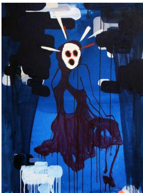
Melou Vanggaard: Balroom Shadow , 2010. Akryl på lærred.