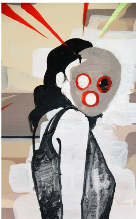
Melou Vanggaard: Bowling Head Woman (detalje) , 2010.