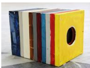
Melou Vanggaard: Just Hangover , 2010. 20 x 20 x 60 cm. Spray, akryl, lærred og skruer.