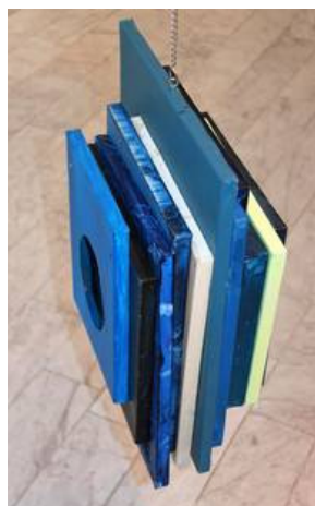
Melou Vanggaard: Blue Hangover , 2010. 55 x 40 x 26 cm. Spray, akryl, lærred og skruer.