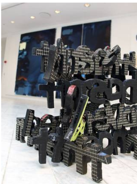
Melou Vanggaard: It Hasn't Stop Changing , 2010. Variable mål. Ordobjekt, hårdtpresset styroform.