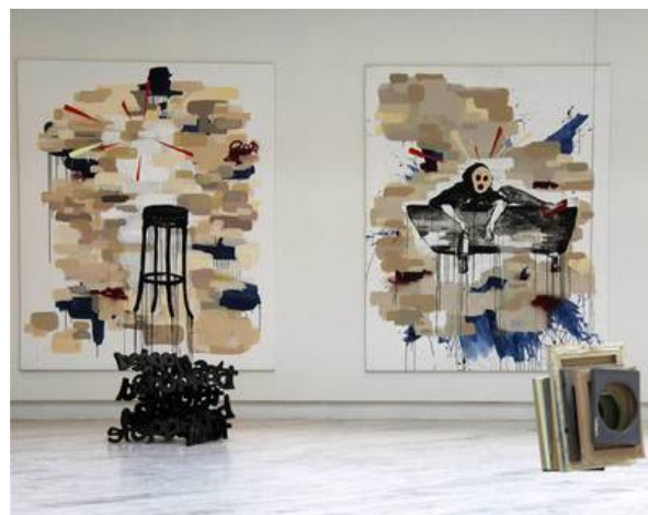
Melou Vanggaard: Melou Vanggaard (Installationview) , 2010.

Traneudstillingen Gentofte Hovedbibliotek, Ahlmanns Allé 6, 2900 Hellerup web site: Mandag-fredag 10-19, lørdag-søndag 11-16