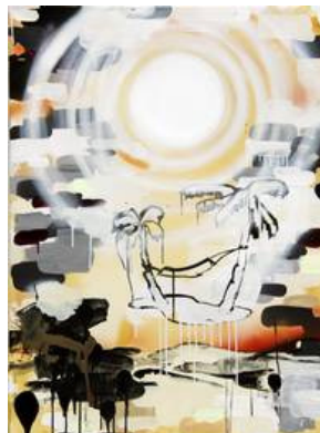
Melou Vanggaard: Sunblind Empty Island , 2010. Akryl og spray på lærred.